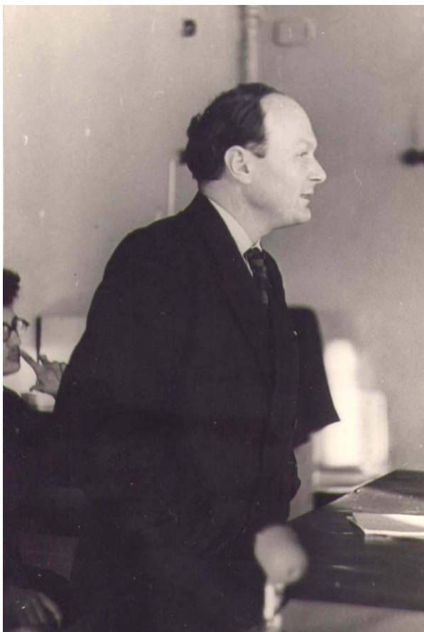
Доклад на защите докторской диссертации. Дубна, 1965 г.